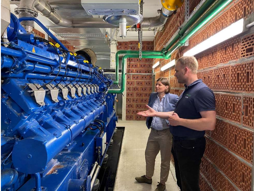
Das Kraftpaket beeindruckt - Flex-BHKW mit 2,3MW macht gerade Pause, weil die Sonne scheint.